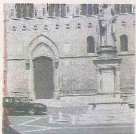
La Banca e il Comune