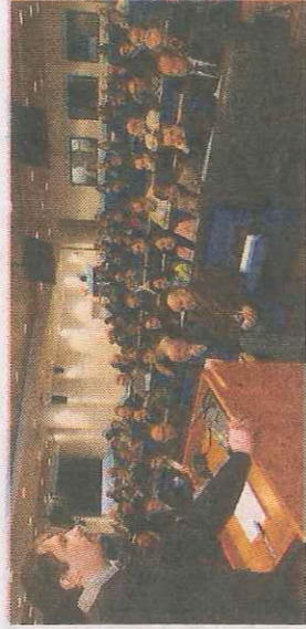
SLOW FOOD L'auditorium dell'Università per Stranieri ha ospitato il congresso regionale